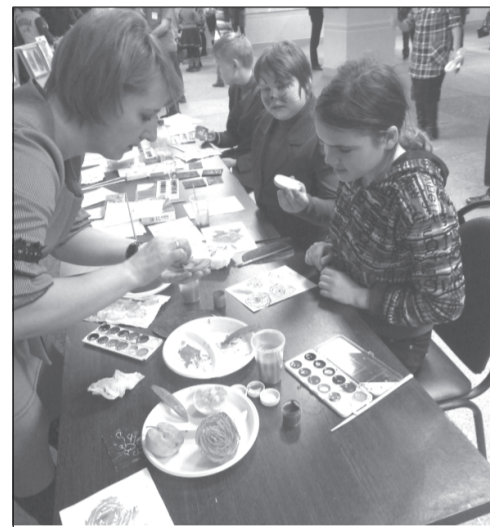
Площадка мини кондитерская «Пульс».

Семьи с удовольствием принимали участие в их работе. В завершении были подведены итоги, состоялось вручение призов от «Единой России» за активное участие. В проекте были представлены театральные номера от детей с ограниченными возможностями здоровья.