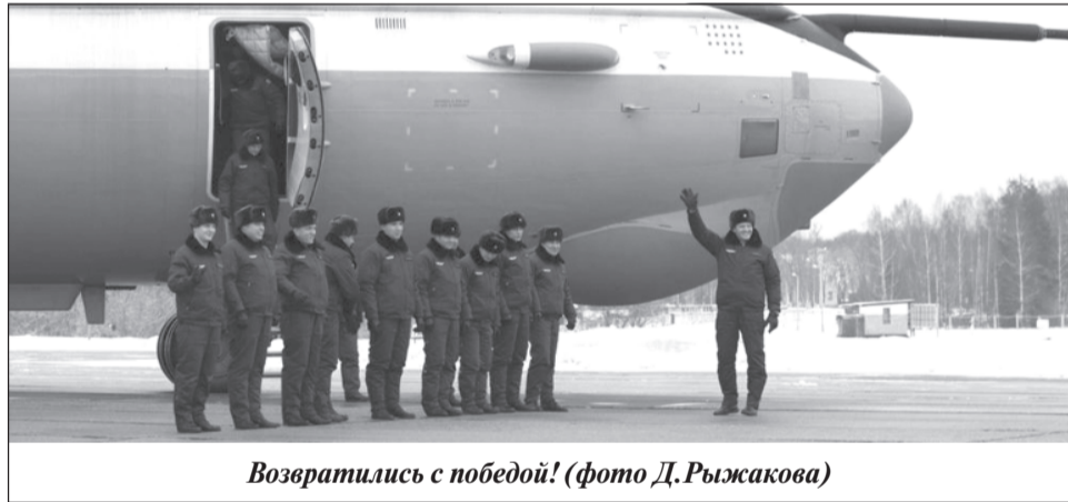
Возвратились с победой!

При встрече на аэродроме в ходе торжественного митинга военнослужащим вручены награды за достойное выполнение боевых задач.