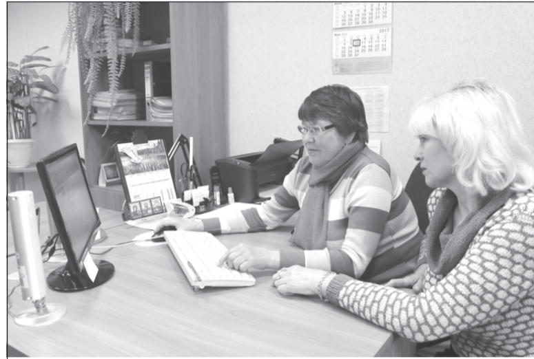
Интернет-помощь старшему поколению.

В комплекс услуг, входящих в систему работы с молодёжью, вхо-