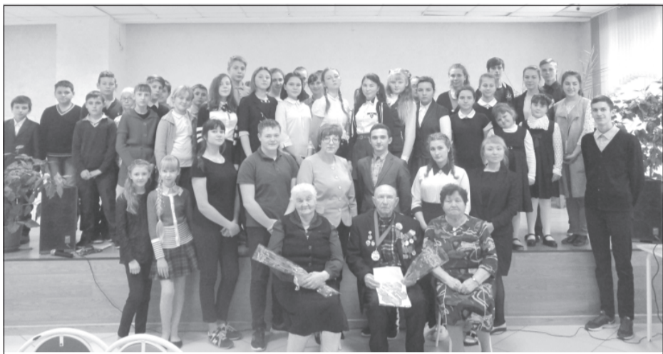
Памяти погибших будем достойны.

Начиная с 2014 года, в нашей стране отмечается новый праздник – День Неизвестного Солдата в память о российских и советских воинах, погибших в боевых действиях на территории страны или за ее пределами.