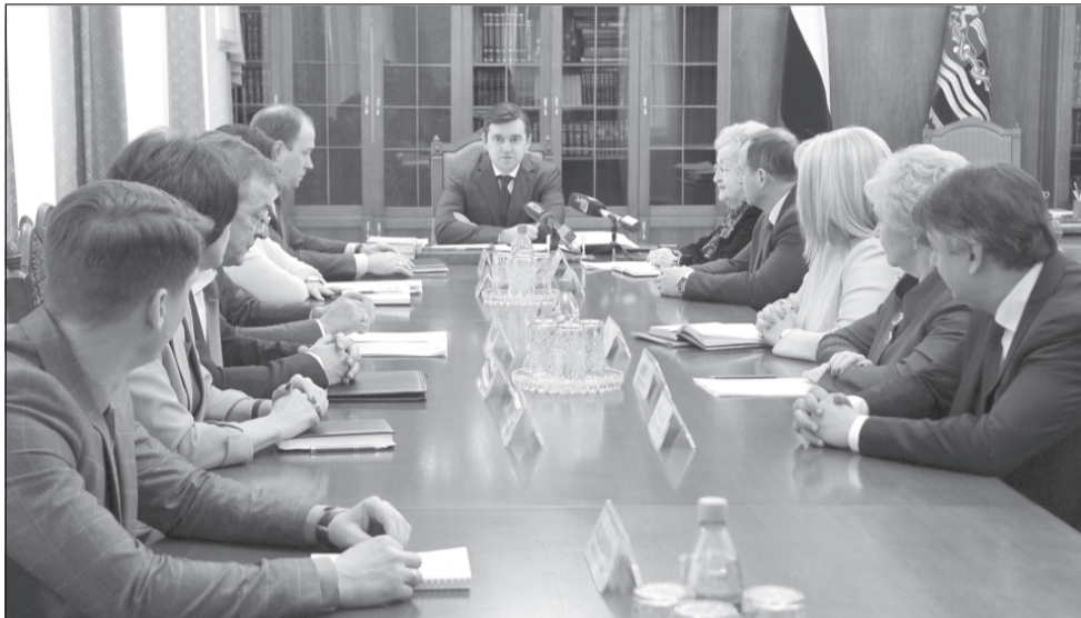
Станислав Воскресенский: «Нужен «диагноз» и предложения по решению проблем».

Временно исполняющий обязанности губернатора Ивановской области Станислав Воскресенский объявил состав правительства региона и представил новых руководителей по направлениям жилищно-коммунального хозяйства, агропромышленного комплекса и сферы привлечения инвестиций.