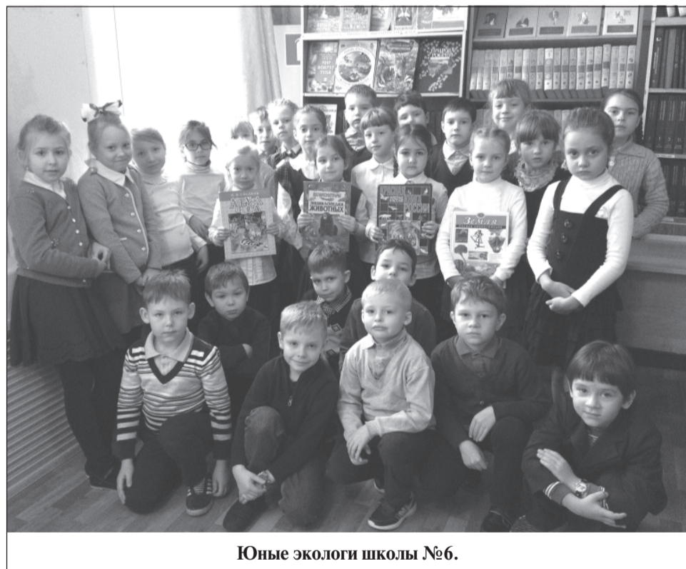
Юные экологи школы №6.

«Без природы в мире людям Даже дня прожить нельзя...»