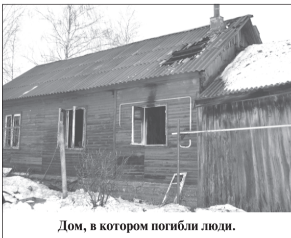
Дом, в котором погибли люди.

Во время пожара погибли мужчина и женщина. Личности погибших устанавливаются.