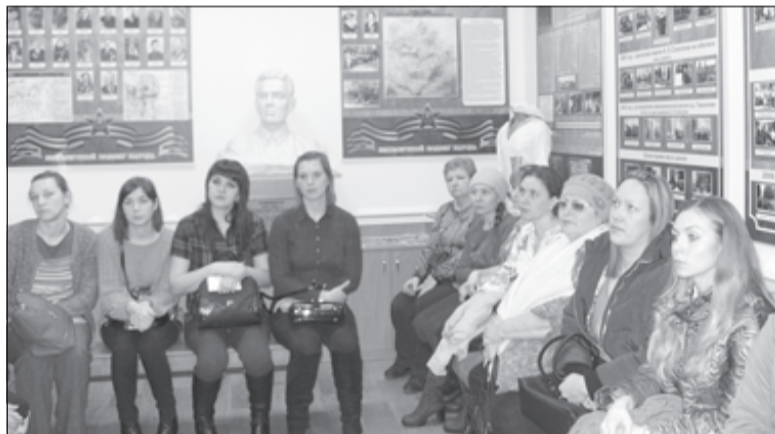
В школьном музее.

В школе №6 прошёл День образовательного учреждения, в рамках которого учителя Е.Л.Груздева и Ю.С.Абрамова провели родительское собрание на тему «Дети в информационном обществе. Профилактика основных интернет-рисков».